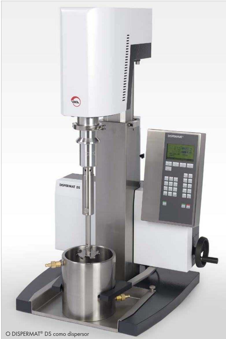
O DISPERMAT® DS como dispersor

Qualidade de ponta para pesquisa e desenvolvimento