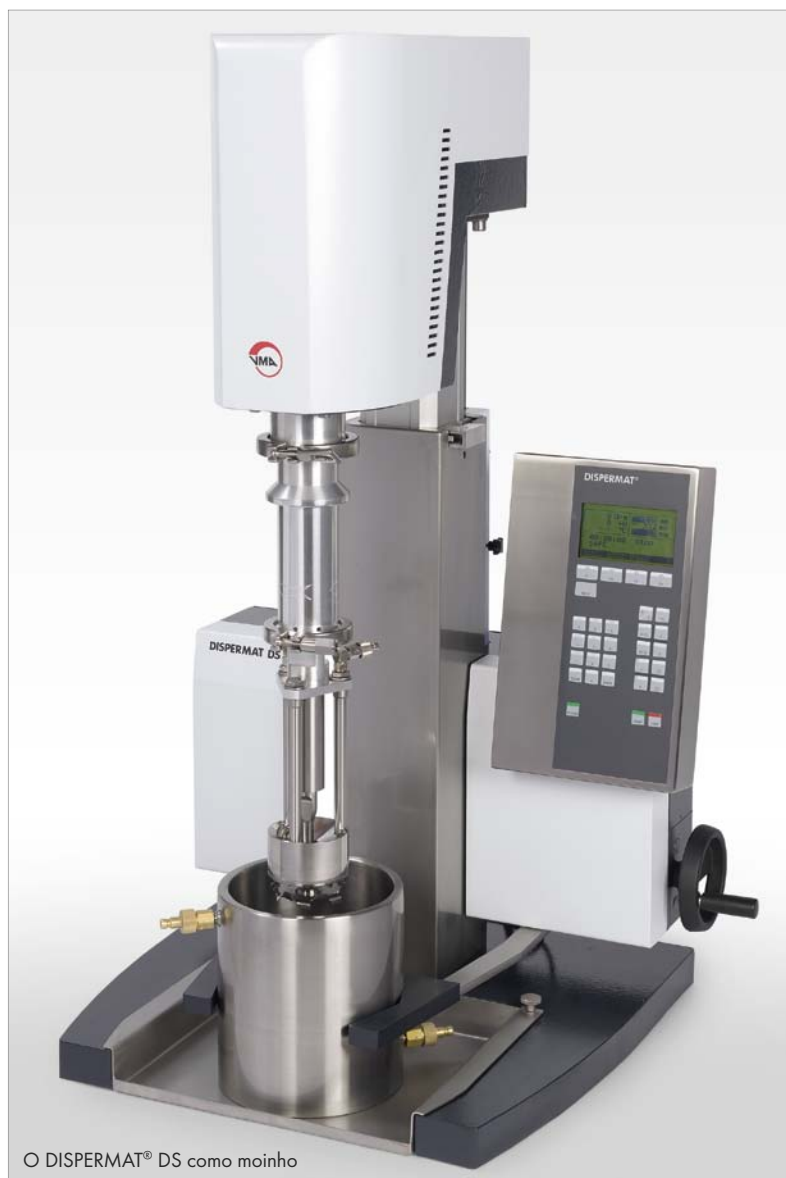
O DISPERMAT® DS como moinho

Outras funções como exportar dados, comparações entre duas curvas de dispersão, marcadores, banco de dados, estão disponíveis para melhorar o desempenho de suas pesquisas.